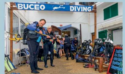
Letzter Equipmentcheck in der Tauchbasis bevor es ins Wasser geht.