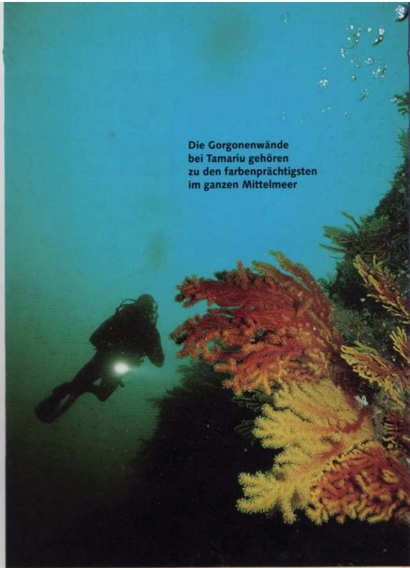
Die Gorgonenwände bei Tamariu gehören zu den farbenprächtigsten im ganzen Mittelmeer

D ass die Basis auf gut 70 Prozent Stammkundenschaft bauen kann, liegt nicht nur an den guten Tauchgründen alleine, sondern auch an den Personen, durch die der Tauchbetrieb lebt: